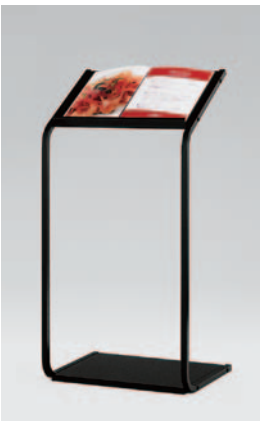
A3メニュー帳をセット