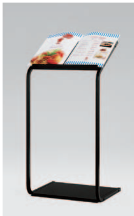
B3メニュー帳をセット