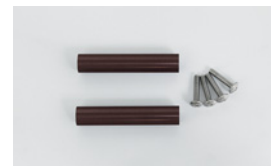
スタンド同士を連結する時に つなげるためのジョイントパイ プです。