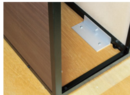
木板に床面金具取付金具 FR セット K を取り付けたところです。