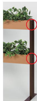
ジョイント用の穴加工と フタが付属します。 ※本体をジョイント仕様加 工したものにのみジョイ ントパイプは使えます。