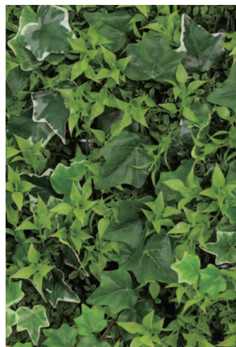
ピース追加 中央部分