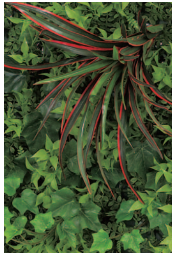
ピース追加 中央部分