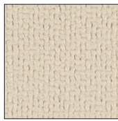
掲示シート仕様 I (アイボリー)