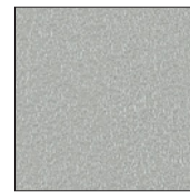
マグネットクロス仕様 GY (ライトグレー)