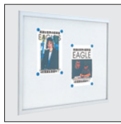
ホワイトボード仕様