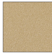
マグネットクロス仕様 I (アイボリー)