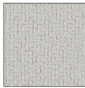
掲示シート仕様 GY (ライトグレー) 価格はお問い合わせください。

標準は掲示シート仕様のアイボリー色です。オプションのマグネットクロス仕様はクロス色をご指示ください。