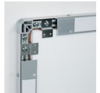
Lアングルにて壁面に取り付け