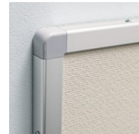
コーナーアールの安全設計