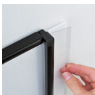
ポスターをスライドセット