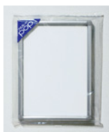
袋入りでの出荷となります