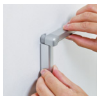
フレームを手前にスライド