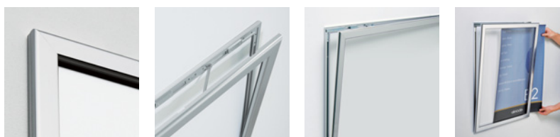
薄型フレーム 過剰開き止め付き 上部が開く、V開き スライドセット

フレームの厚さ21mmの薄型フレームでB0ヨコサイズまで対応。 カギも付けられるのでイタズラ防止に役立ちます。