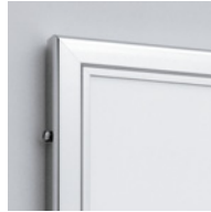
簡易ロック標準装備