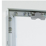
クリップ金具付き