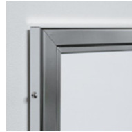
(ローレットビスは付属の⊕ネジに交換可能です)