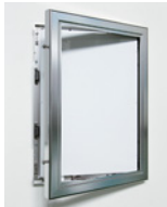
扉を手で開いてソフトをセットします。