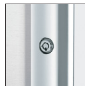
鍵(フレーム正面に付きます) 2ヶ…¥15,200(税込¥16,720)