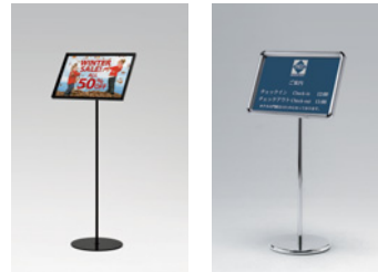
2835 K 217 S