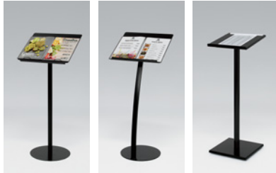
2367 K 2368 K 2379 K