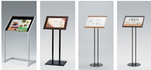
2357 K 2837 SP 2836 WD 2838 SP

2357 →P.197 2837 →P.198 2836・2838 →P.199