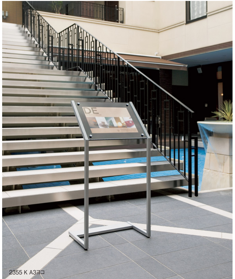
2355 K A3ココ