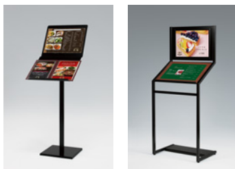
2369 K 2359 K