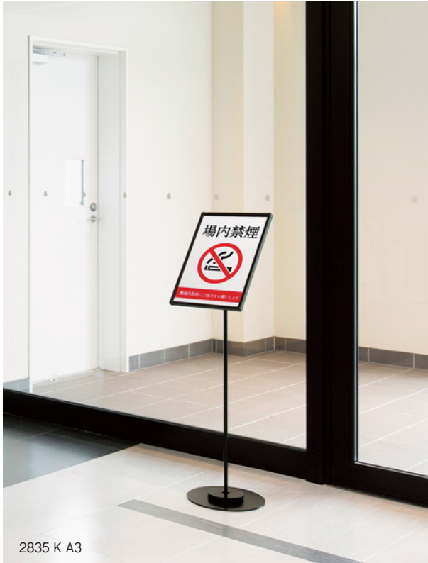
2835 K A3

出力プリントを簡単にセット・交換して使えるフロアスタンド。 スッキリデザインの情報スタンド、 お店のイメージに合わせて選べるメニュースタンドなど豊富な デザインバリエーションの中からお好みのものをお選びいただけます。