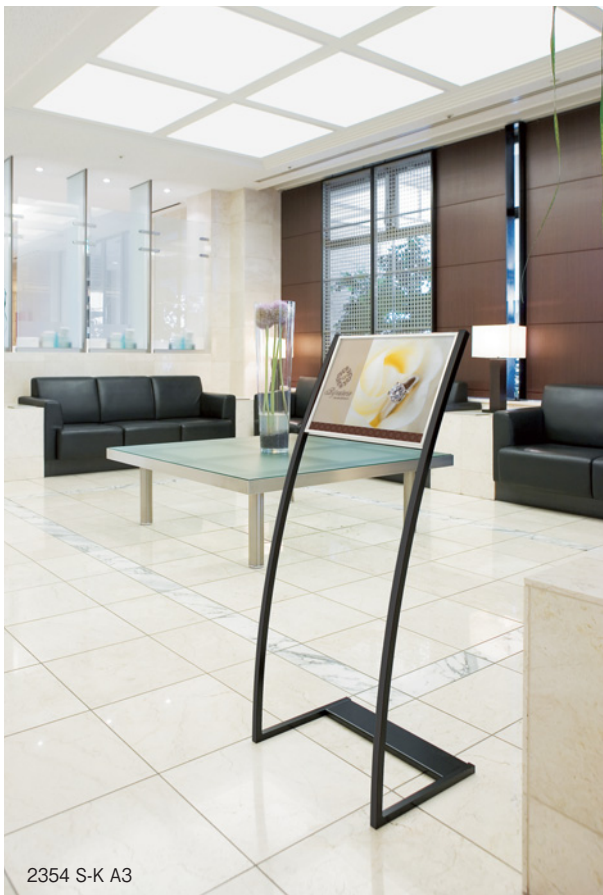
2354 S-K A3