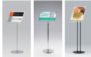
2833 S-C 2303 S 2834 S-K