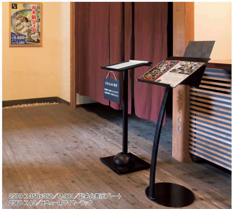
2379 K 350×350/M-981 / 記名台表示プレート 2368 K A3 / メニュー用ワイヤーラック