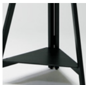
脚部下の板に小物を飾 れます