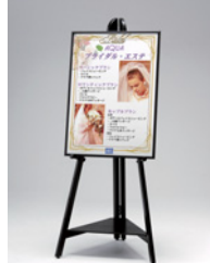
パネル:AP340 WD5 A2