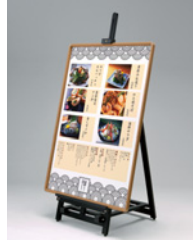
パネル:333 WD A0