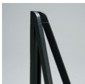
上部はやわらかい アールで安全

対応サイズ: A3-B3・A2-B2・A1-B1 パネル厚30mmまで 本 体: 木材 塗装仕上 重 量: 3.0kg 静止安全荷重: 8kgまで 棚 板: 3kgまで 折りたたみ式