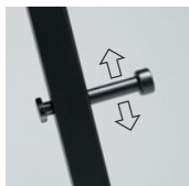
パネル受けの高さ調節が できます