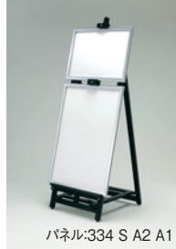
パネル:334 S A2 A1