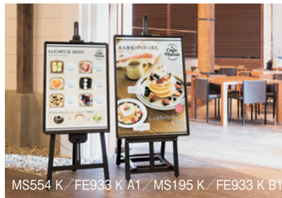
MS554 K / FE933 K A1 / MS195 K / FE933 K B1

対応サイズ: A2-B2・A1・B1・A0 パネル厚32mmまで 本 体: 木材 塗装仕上 重 量: 6.3kg 静止安全荷重: 合計8kgまで 折りたたみ式