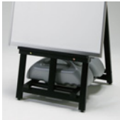
オプションウエイト セット使用時

パネル受けは本体穴にネジ固定でずれずにガッチリ。 4本脚で安定、脚部の保持バーは開き止め、 閉じ止め、ウエイト乗せを兼用していて 折りたたむこともできます。