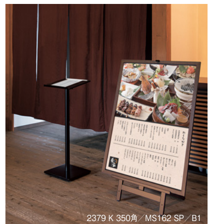
2379 K 350角 / MS162 SP / B1