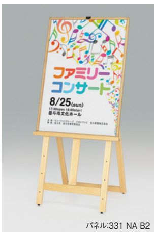
パネル:331 NA B2