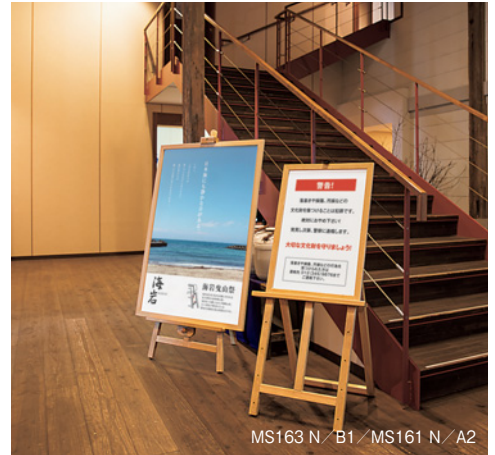
MS163 N / B1 / MS161 N / A2