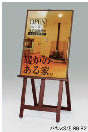
パネル:345 BR B2