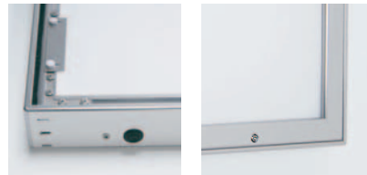
コードは付いておりません