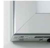
コードは付いておりません