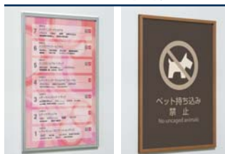
S P.120 WD P.120