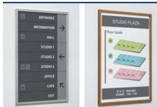
S P.120 WD P.120