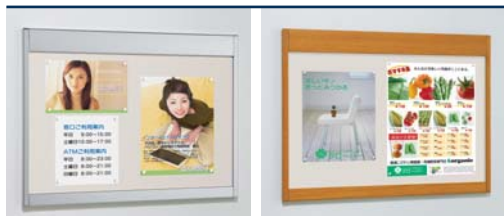
S P.96 WD P.96