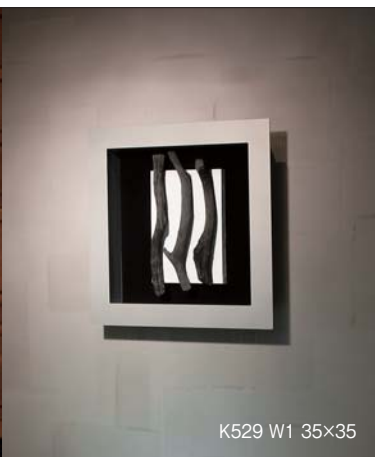
K529 W1 35×35