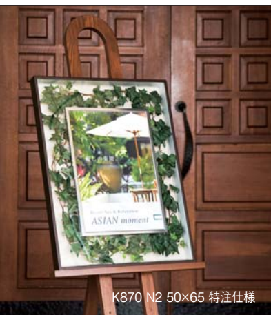
K870 N2 50×65 特注仕様