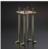
長円支柱アンカー 2ヶ…¥17,000(税込¥17,850)