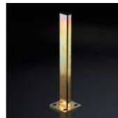
長円支柱補強柱 2ヶ…¥11,000(税込¥11,550)