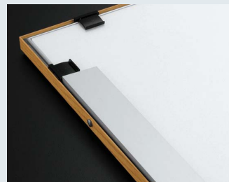
吊り金具とひもは付属しますが、直 付けする場合はオプションの壁面 取付アングルをお求めください。(金 具やフレームに穴あけが必要です)

ディスプレイフレームは、加工業者様向けのパネル用化粧部材フレームです。3mmのアルミ複合板や5~7mmのハッポーパネルで製作した解説POPやメニュー、イメージパネルなどの仕上げに最適です。フレームはご注文をいただいてからオーダーでご要望のサイズにカットし(フリーサイズ)フレーム枠のみの状態(組立てキット)で出荷します。お客様で組み立て、お手元のパネルをセットしてもらえば完成です。