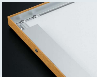
しっかり取り付けたい場合は、 オプションの壁面取付アングルをお 求めください。(金具やフレームに穴 あけが必要です)