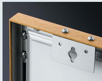
付属のアルミアングル吊りを使って、壁掛けや吊り下げでお使いください。