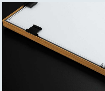
裏からパネルをセットして完成。