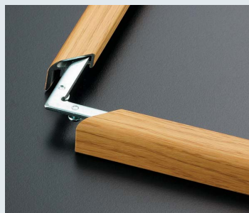
コーナーをLブロックで組み合わせ ドライバーでネジ締めします。