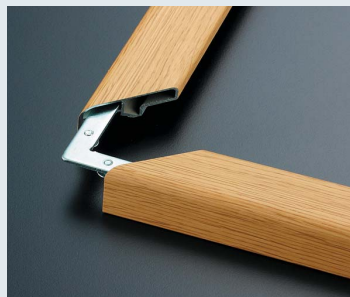
コーナーをLブロックで組み合わせ ドライバーでネジ締めします。