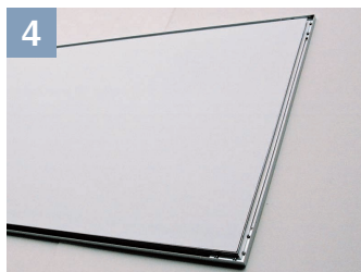
4 別途ご用意いただいた3mmアルミ 複合板を取り付けます。