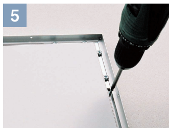
5 フレームの溝から壁面へ取り付けます。 ※壁面取付ビスは、取り付ける壁面に合わせて別途ご用意ください。