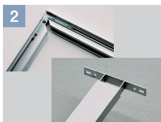
2 コーナーを組み合わせていきます。